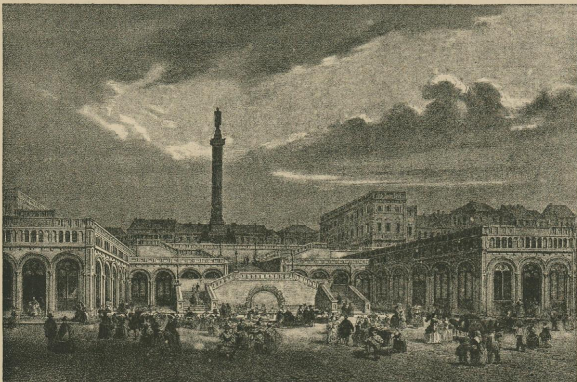
LA COLONNE DU CONGRÈS, VUE DU MARCHÉ DU PARC.

La cérémonie fut imposante. L'église était pleine de foule, une foule silencieuse, au-dessus de laquelle éclataient les foudres des grandes orgues. Puis, quand tout se